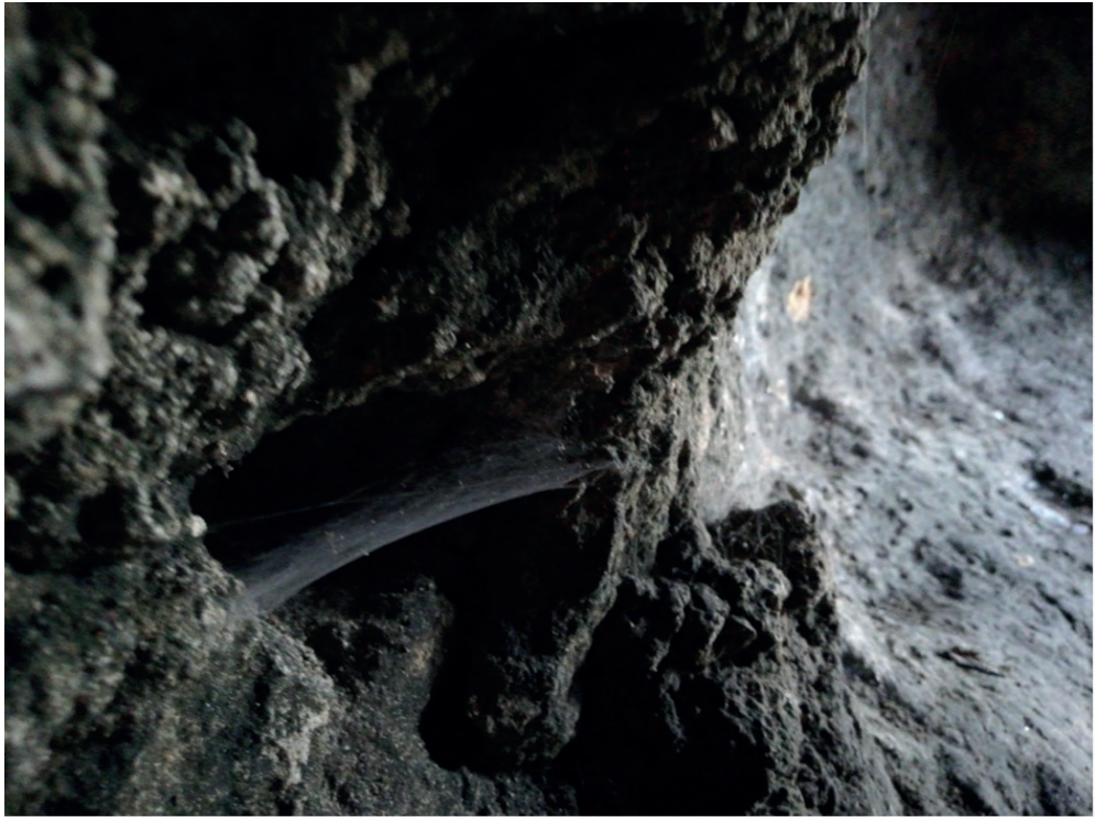
Figura 1. Foto. Antonio Bueno García, Cueva de Cervantes, Argel