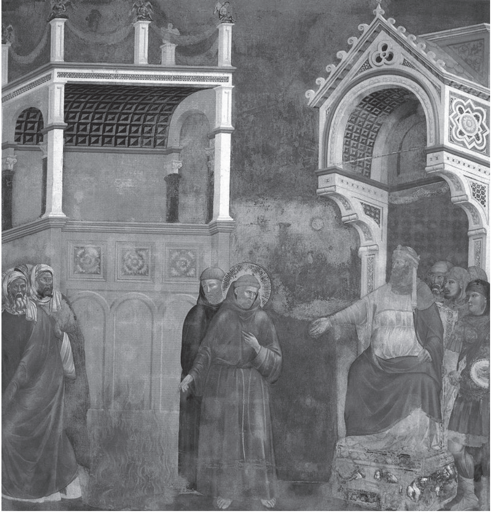
Figura 1. Prueba de fuego ante el Sultán. Atribuido a Giotto di Bondone, c. 1290-1300. Basílica de San Francisco en Asís (Italia)