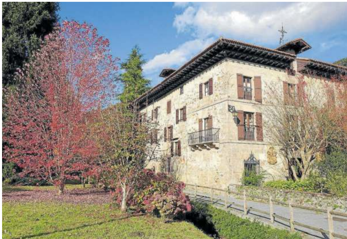
Pío Baroja adquirió Itzea, en Bera, en 1912.

recuerda los años de su infancia que vivió en la ciudad (1881-1886), y también tengo vínculos con el Bidasoa, pero nunca había hecho nada sobre él y cuando me puse a ello me di cuenta de que no solo había tema, sino mucha gente experta que podía realizar buenas aportaciones”, señala el coordinador de Baroja y Navarra .