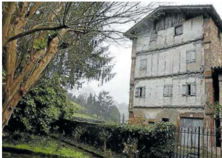
Casa Portu, en Bera, podría ser un centro patrimonial.

De hecho, continúa el profesor, esta familia es el elemento central de obras