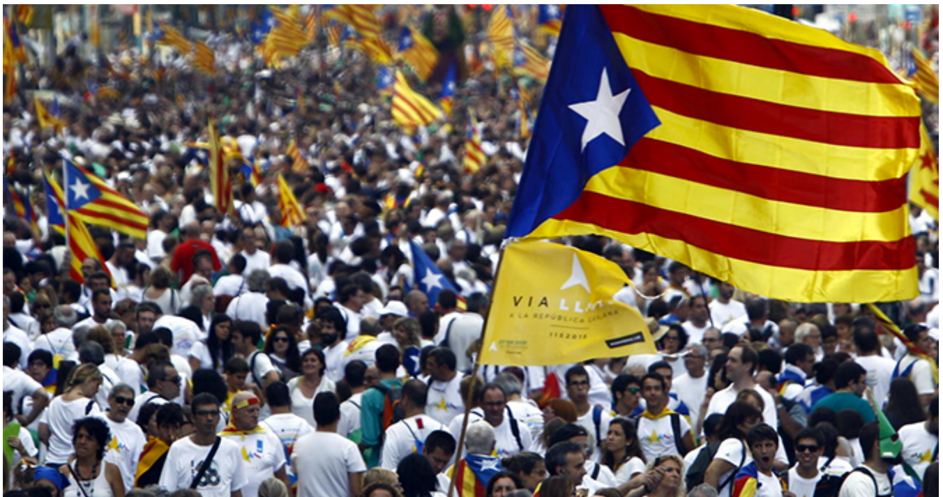
Manifestación independentista organizada por el nacionalismo catalán

En este sentido, los investigadores describen las corrientes que, según las opciones políticas, han abordado el asunto regional , tratándolo desde diferentes puntos de vista que, por acumulación, aportan un completo palimpsesto sobre el estado de esta cuestión. Aunque hoy parezca desfasada la palabra regional –orillada en la Transición y sustituida por la idea de Estado de las Autonomías , e incluso por la expresión nación de naciones –, el libro muestra la verdadera raíz de un problema que podría no haber derivado en conflicto sino en fortaleza.