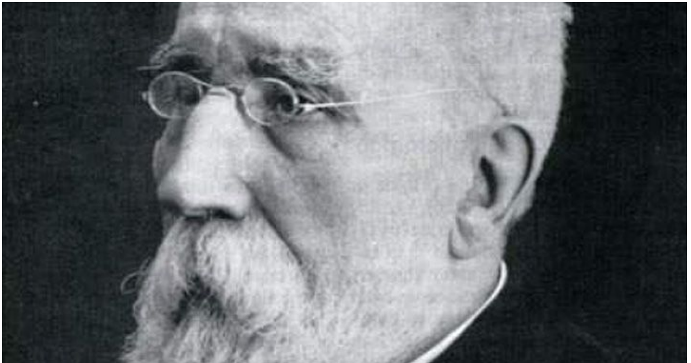
Francesc Pi i Margall

de departamentos de Historia Contemporánea– con precedentes como Jaume Vicens Vives y su libro Noticias de Cataluña , al que seguirían Joan Fuster en Valencia con “ Nosaltres les valencians ” o Josep Meliá en Els Mallorquins . Los autores de este trabajo resaltan que el relato de la identidad catalana hasta los años ochenta bebió del estudio de las relaciones entre Cataluña y España y los orígenes del movimiento catalanista. Como si la construcción de ambas identidades estuvieran condenadas a reforzarse.