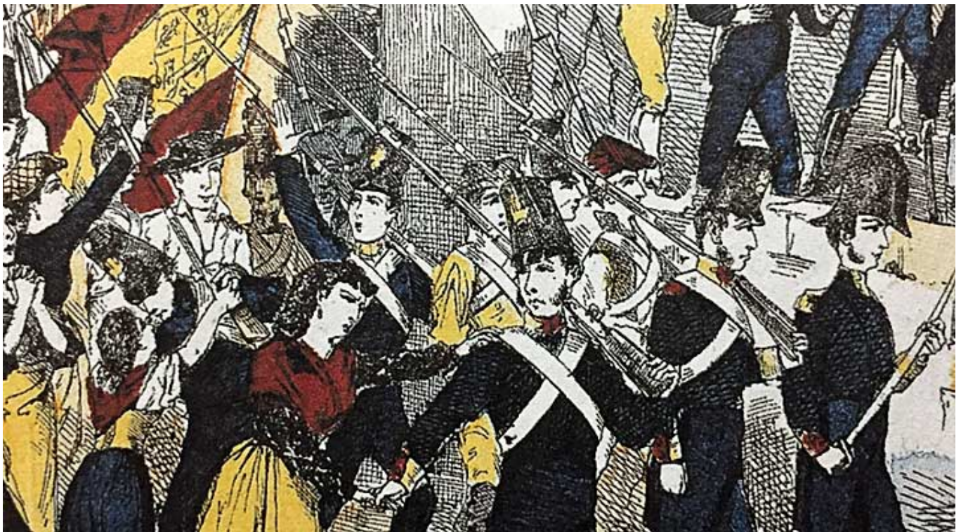
El catalanismo en tiempos de Napoleón

Una maniobra del franquismo para parecer “aproximadamente moderno” –según el término de Luis Buñuel – que es idéntico al que encierra la noción del regionalismo. En este caso, mediante “su codificación desactivadora, su homogeneización y reducción a cuestiones puramente formales y anecdóticas”. Así, se asimiló la aceptación de un folclore diverso con la organización administrativa del Estado sin que se vulnerara la idea monolítica que el régimen militar tenía de España. Desde los años sesenta se habla de un regionalismo funcional que propicia una estructura burocrática y administrativa que, sin embargo, quedó a medias. La idea de la patria asumía el tipismo pero sus costuras no toleraban mucho más.